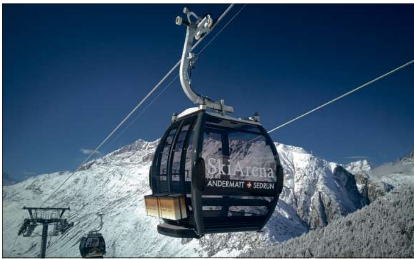
La colligiaziun dils territoris da skis Andermatt e Sedrun s'avonza. Sonda vegnan la nova telecabina «Gütsch-Express» e duas sutgeras aviartas.

Sedrun. La fiasta d'inauguraziun entscheiva allas 12.00 alla staziun amiez dil Nätschen. El restaurant da famiglia dat ei punsch e Hot Dogs gratuits pils affons e ligiongias pils carschi. Il team dalla tecnica dat investa ella garascha/luvatori e stat a disposiziun per damondas. Ella nova MATTI KidsArena dat ei in program da divertiment ed attracziun pils affons.