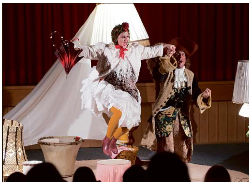
Scena or dal toc «Giaglina Ida & Stgilat Pilat cun Marina Blumenthal e Lorenzo Polin. MAD

Reservaziuns èn necessarias ed ins po far quella sin www.klibuehni.ch Ulteriuras infurmaziuns: www.bagat.ch