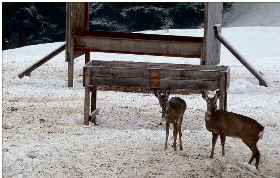
Daspö decennis desistan ils chatschaders da pavar d'inviern la sulvaschina pro las pavladuoiras.