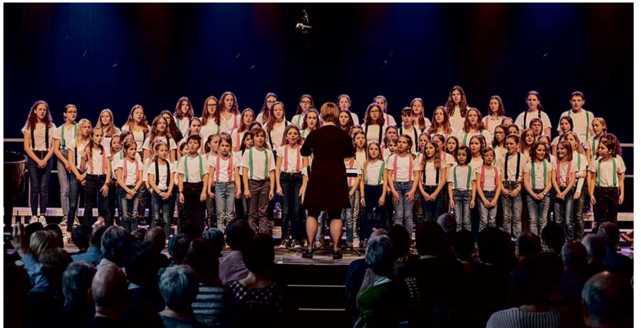
L'emprima ediziun dal Festival da la chanzun rumantscha a Trun è stada in success. Era la segunda ediziun en Engiadina vul dar in palc spezial al chant da chors d'uffants.

L'organisaziun dal segund Festival da la chanzun rumantscha è lantschada